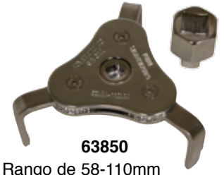
63850 Rango de 58-110mm