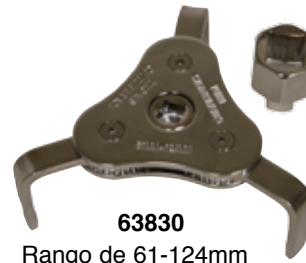
63830 Rango de 61-124mm