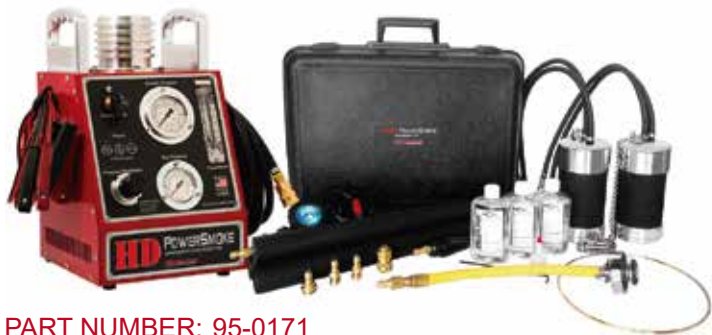
PART NUMBER: 95-0171